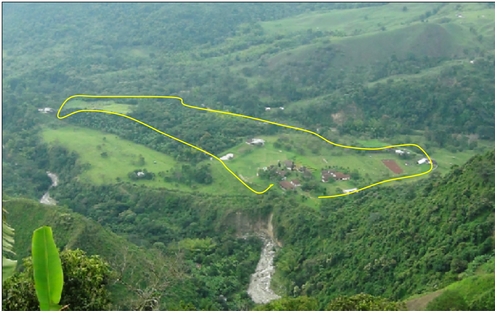
Sendero Ecológico de Educación Ambiental